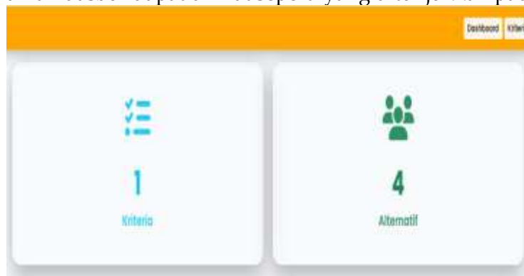
Gambar 3 Halaman Dashboard

2. Antarmuka halaman dasbor dapat dilihat seperti yang ditunjukkan pada gambar berikut: